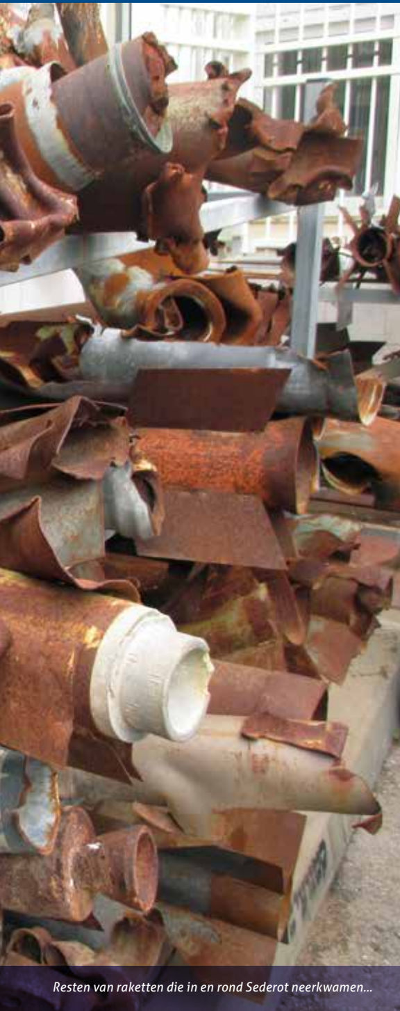
Resten van raketten die in en rond Sederot neerkwamen...