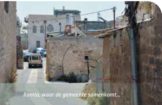
Ramla, waar de gemeente samenkomt...

De gemeente ontwikkelde een groot hart voor armen, alleenstaande moeders en nieuwe immigranten. 'We begonnen met humanitaire hulp, slechts sommigen van de mensen kwa-